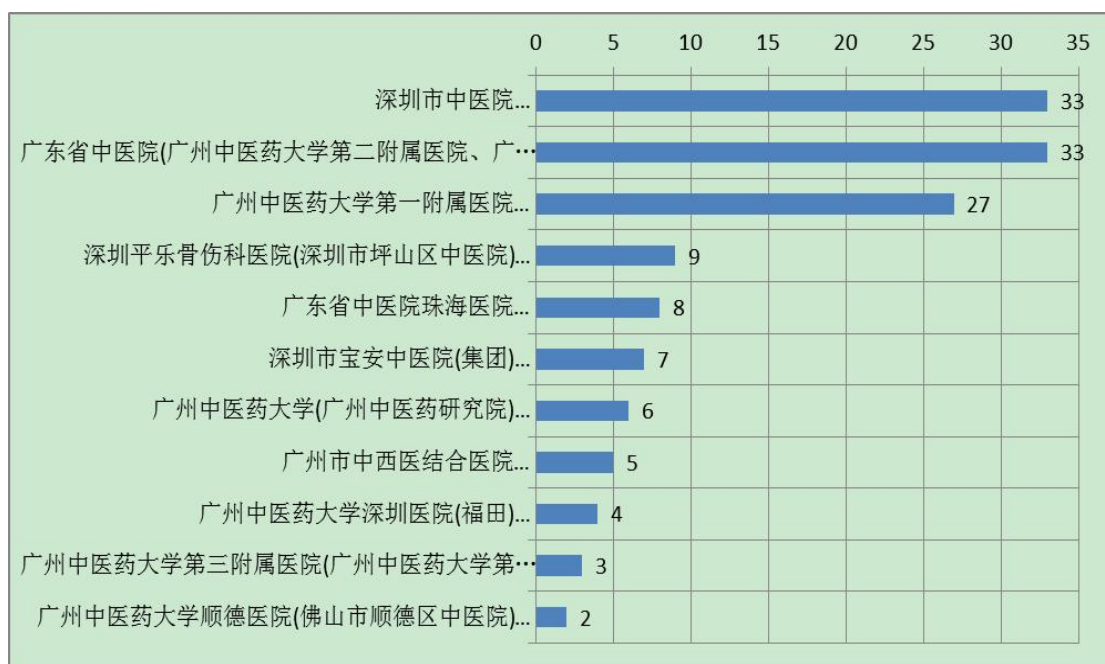
图3 2021年第2季度我校及其附属机构实用新型专利申请人排名

在外观设计专利授权数量方面，包括广州中医药大学第一附属医院、广州中医药大学（广州中医药研究院）、广东省中医院（广州中医药大学第二附属医院、广州中医药大学第二临床医学院、广东省中医药科学院）、广东省中医院珠海医院4个申请人，具体排名见图4。