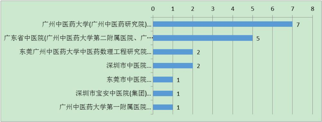
图 2 2021 年第 2 季度我校及其附属机构发明专利申请人排名

州中医药大学第一附属医院、广东省中医院(广州中医药大学第二附属医院、广州中医药大学第二临床医学院、广东省中医药科学院)、深圳市中医院、东莞广州中医药大学中医药数理工程研究院、深圳市宝安中医院（集团）、东莞市中医院 7 个申请人，具体排名见图 2。